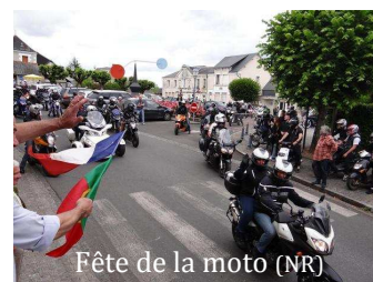
Fête de la moto (NR)