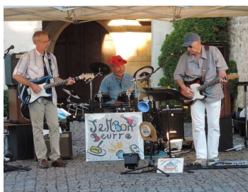
Fête de la musique 2015

Les comptes-rendus détaillés des Conseils Municipaux peuvent être consultés sur www.sache.fr ou en Mairie.