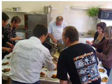
Rando Pot au feu cuisine