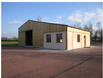
Bâtiment du site d'activités des Aunays