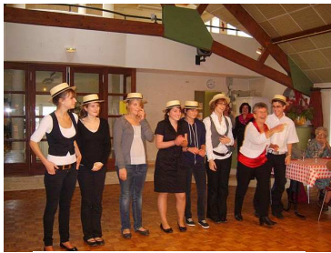
Repas des anciens Les serveurs