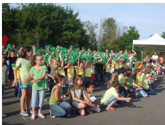
Fête de l'école

En Septembre, la commission prendra rendez vous pour la visite de ces trésors dissimulés aux yeux des passants.